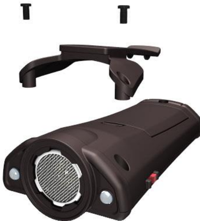
Рисунок 3 – схема установки клипсы

1.4.3 Клипса (поз. 8 рисунок 2), предназначенная для возможности закрепления изделия на пояском ремне, в состоянии поставки не установлена на корпусе изделия и может быть по желанию установлена самим пользователем, для чего в комплекте с изделием поставляются два самонарезающих винта увеличенной длины, которыми нужно заменить имеющиеся в корпусе. Схема установки клипсы представлена на рисунке 3.