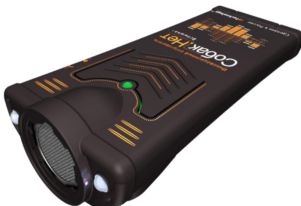
Рисунок 1. – внешний вид изделия

1.2.1. Внешний вид изделия показан на рисунке 1.